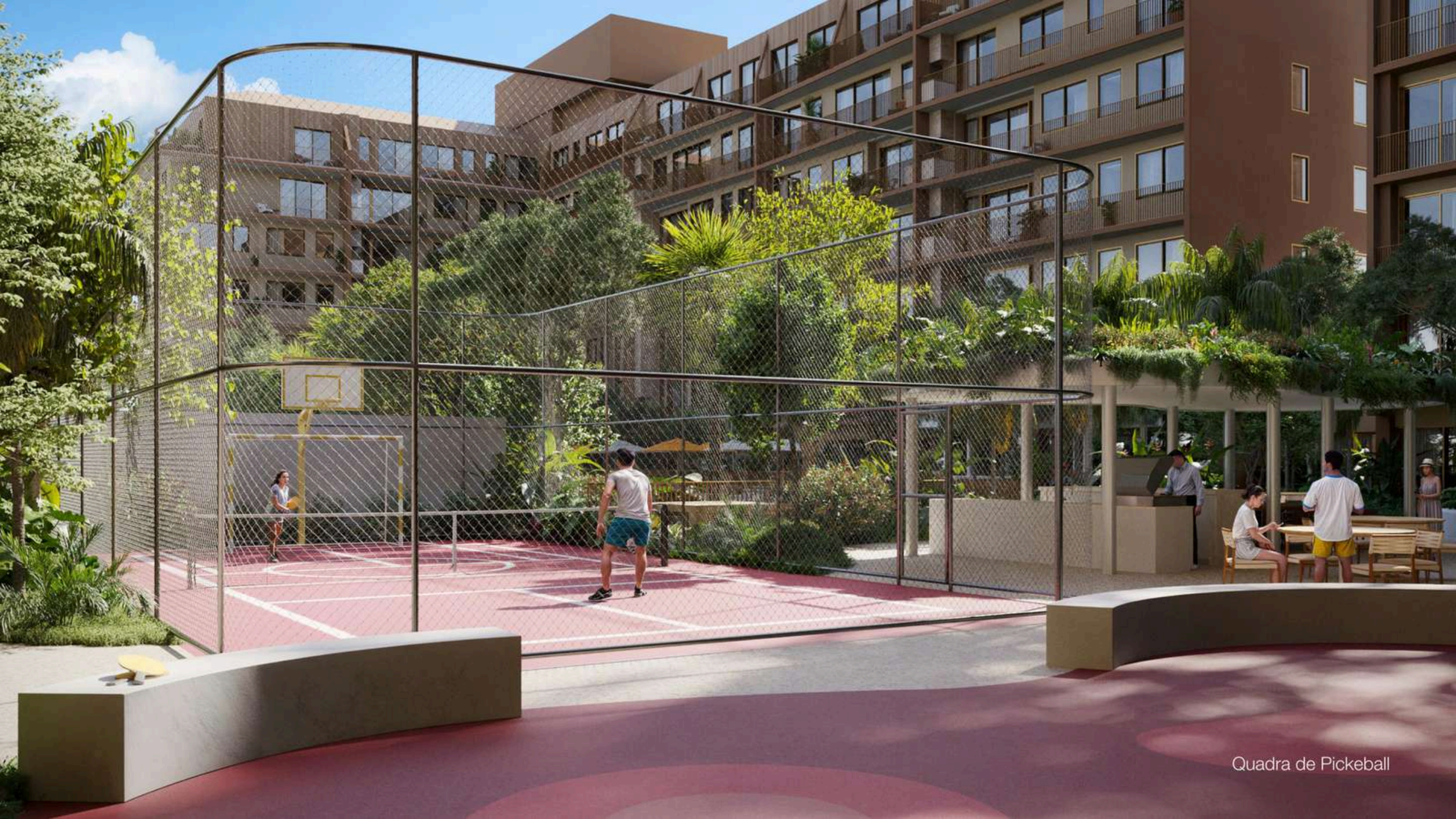
Quadra de Pickeball